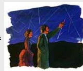
La gran lluvia de estrellas ocurrió el 13 de noviembre de 1833.