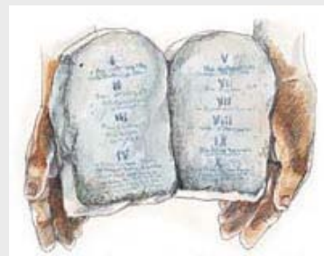
La Biblia dice que el Anticristo cambiaría la ley de Dios

En su catecismo, el papado ha omitido el segundo mandamiento contra la veneración de imágenes y ha acortado el cuarto mandamiento de 94 palabras a ocho, también ha dividido el décimo en dos mandamientos. (Compruébelo usted mismo. Compare los Diez Mandamientos registrados en cualquier catecismo católico con la lista de los Diez Mandamientos redactados por Dios, de Éxodo 20:3-17). No hay lugar a dudas que el poder del cuerno pequeño del capítulo 7 de Daniel (el Anticristo) es el papado. Ninguna otra organización puede cumplir estos nueve puntos. Y, a propósito, esta no es una enseñanza nueva. Todos los reformadores, sin excepción, identificaron al papado con el Anticristo. 8