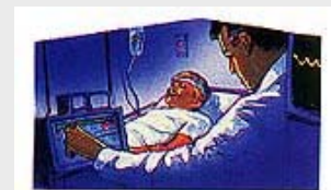
Una persona puede sufrir debido a los hábitos perniciosos de sus padres o abuelos.

Answer: Dios ha expresado claramente que los hijos y los nietos pagan a veces por las insensateces de los padres que ignoran las leyes sanitarias divinas. Los hijos y los nietos heredan cuerpos enfermos y debilitados, porque la madre y el padre desafiaron las reglas que Dios estableció para la vida. ¿Es esto lo que usted quiere para sus queridos hijos y nietos?