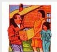
Ayudar a las personas en necesidad mejora nuestra salud.

J. Haga del momento de la comida una ocasión agradable. "También que es don de Dios que todo hombre coma y beba, y goce el bien de toda su labor" (Eclesiastés 3:13). Las escenas y discusiones desagradables en ocasión de las comidas, trastornan la digestión. Evítelas.